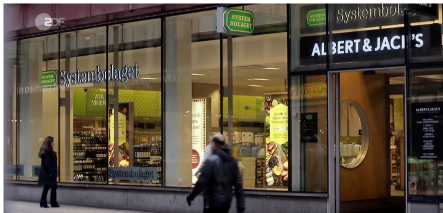
Alkohol nur in bestimmten Supermärkten: In Schweden wird deutlich weniger getrunken. ZDFzoom

Schweden – genau wie Norwegen – gehört in Europa zu den Ländern mit dem niedrigsten Pro-Kopf-Konsum von Alkohol. Die Schweden tranken 2015 laut Weltgesundheitsorganisation im Schnitt 8,7 Liter Reinalkohol pro Kopf. Wir Deutschen tranken dagegen 10,6 Liter. Deutschland liegt damit im europäischen Mittelfeld.