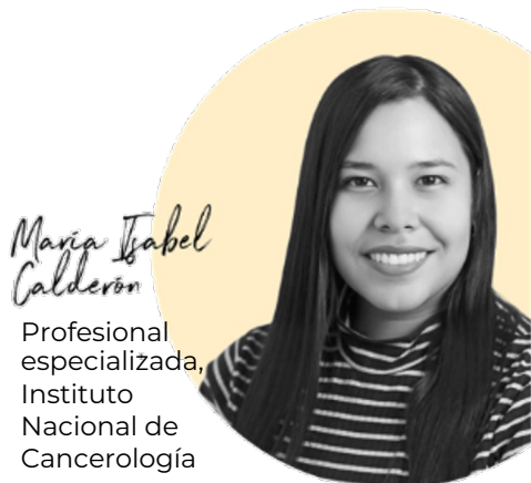
Profesional especializada, Instituto Nacional de Cancerología

También puedes seguir al Instituto Nacional de Cancerología en LinkedIn .